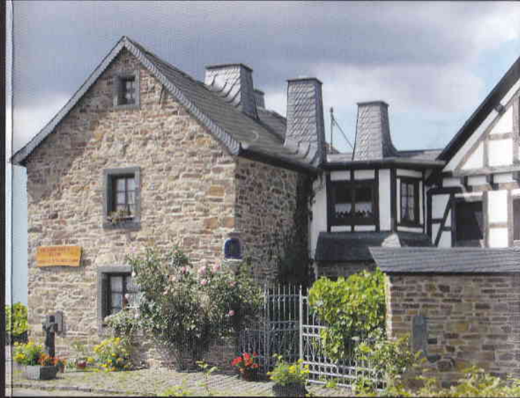
Eingangsbereich des Museums in dem etwa 400 Jahre alten Bauernhaus.