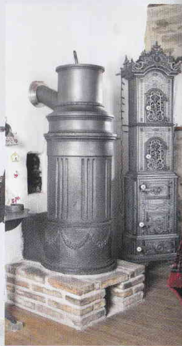
Küppersbusch-Ofen um 1900.