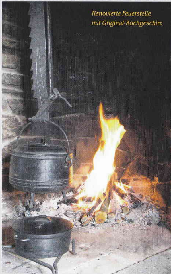
Renovierte Feuerstelle mit Original-Kochgeschirr.

Wer in die Hauptstraße 79 im Mayener Stadtteil Kürrenberg kommt, begibt sich auf eine Zeitreise.