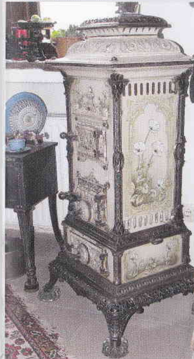
Rechts der betriebsbereite Original Hinterlader.

In dem liebevoll restaurierten Fachwerkhaus findet der Besucher auf zwei Etagen mit circa 200 qm Ausstellungsfläche mehr als 70 Öfen und Herde samt Zubehör aus vier Jahrhunderten, verschiedenen Epochen und Stilrichtungen.